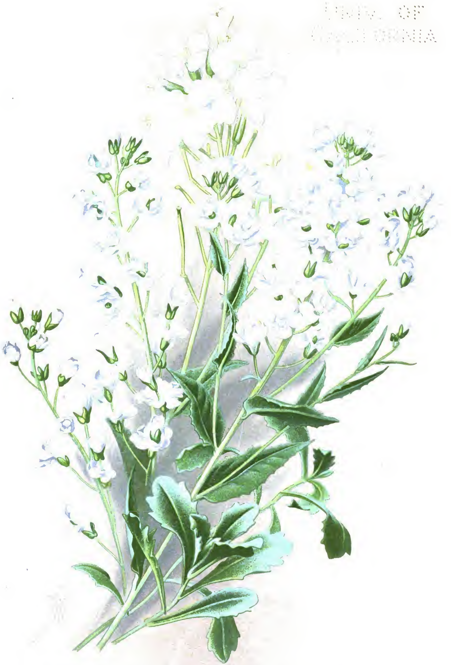
Hesperis matronalis var. candidissima (1.); Hesp. matronalis flore albo pleno (2.); Arabis alpina flore pleno (3.).

Простая [1.] и махровая [2.] белая ночная фиалка; Альпийская фиалка махровая [3.].